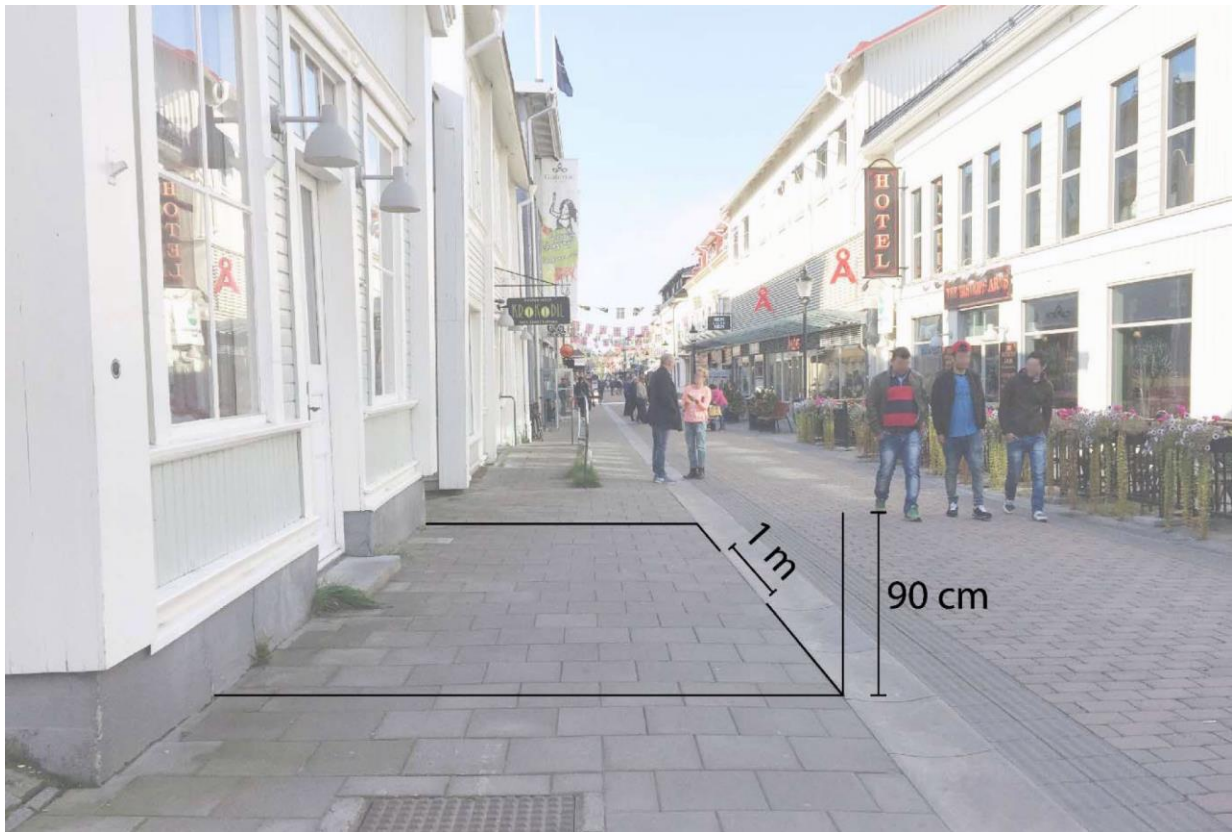
Bild 1: Illustration som visar att uteserveringar längs gågatan ska placeras i direkt anslutning till fasaden och får sträcka sig ut till rännan.